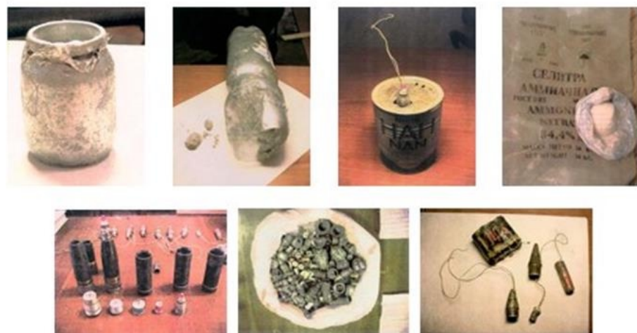
Фотографии взрывных устройств и их компонентов, изготовленных из штатных боеприпасов, аммиачной селитры и алюминиевой пудры, изъятых в процессе оперативно-розыскных мероприятий оперработниками ФСБ России

ПОМНИТЕ: внешний вид предмета может скрывать его настоящее назначение. В качестве камуфляжа для взрывных устройств используются обычные бытовые предметы: сумки, пакеты, свертки, коробки, игрушки и т.п.